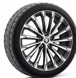
2.0 TSI/ 204hp 19吋Becrux金屬黑鋁合金輪圈