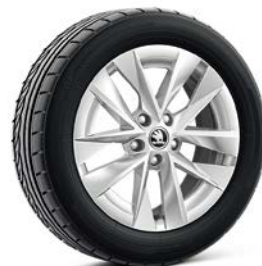
1.5 TSI/ 115hp (選配) 17吋Rotare空力銀鋁合金輪圈