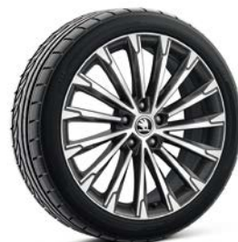
2.0 TSI/ 204hp 19吋Becrux金屬黑鋁合金輪圈