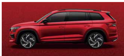
炫彩紅 K1K1 (需加價選購)