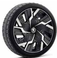
20吋 SAGITARIUS AERO 鋁圈