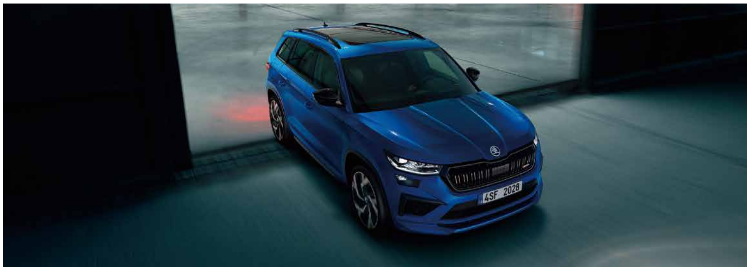
Škoda Kodiaq RS 勁裝登台