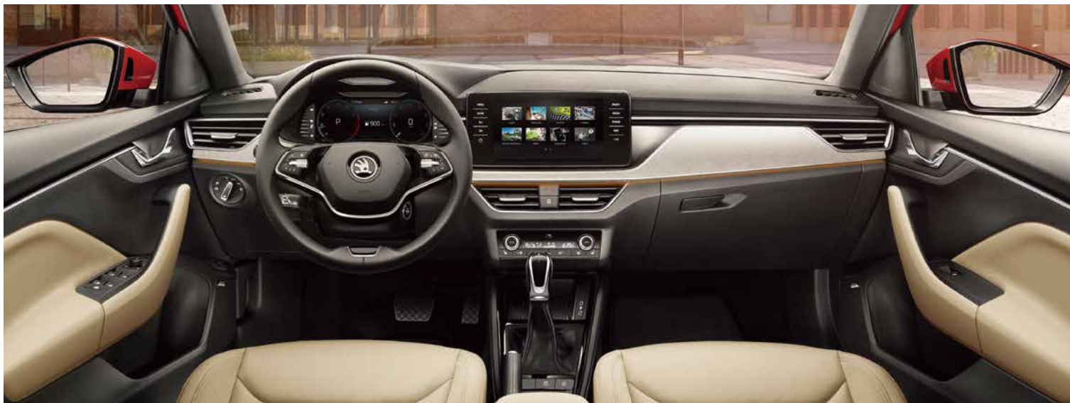
Kamiq內裝配備了高檔材質與一流工藝，更搭載了“10.25吋全螢幕全彩數位儀表”，動人的設計也伴隨著完美功能性。