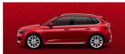
炫彩紅 K1K1 (須加價選購)