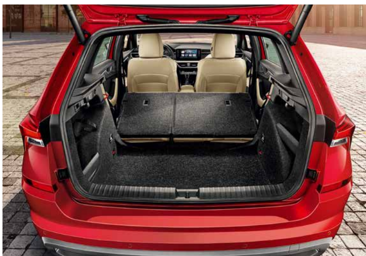
將後排座椅倒下後行李廂空間可以從400公升增加到1395公升，Kamiq讓你更聰明運用空間！