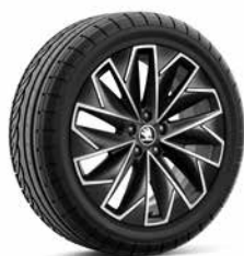
17 吋 PROPUS AERO 鋁圈