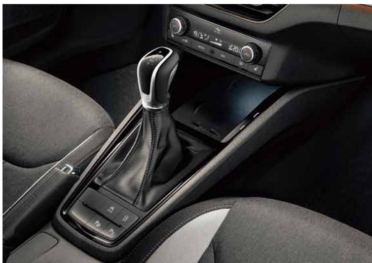
Kamiq同時配備了手機無線充電板及四個USB-C插孔，手機沒電的不安全感從此消失。