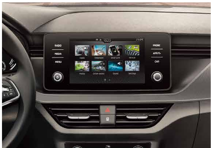
“SmartLink+”智慧型裝置互連系統套件，用一條線就可以將你的手機和愛車連在一起。搭配手機內建的導航系統透過簡單的語音指令，輕鬆地帶你抵達目的地。