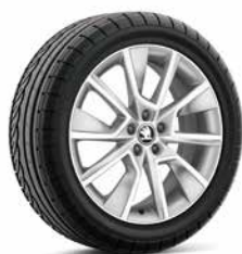
17 吋 BRAGA 鋁圈