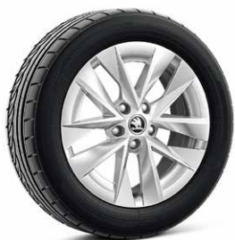
1.5 TSI/ 115hp (選配) 17吋Rotare空氣鋁合金輪圈