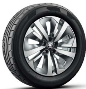
18" "SOIRA" 鋁圈