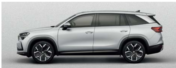
亮銀 | 8E8E