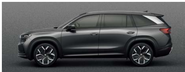
石墨灰 | 5X5X