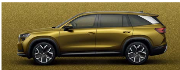
琥珀金 | P4P4