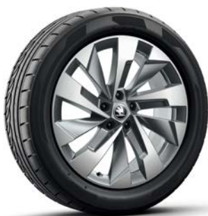
19" "HALTI" 鋁圈