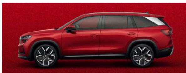
炫采紅 | K1K1 (加價選購)