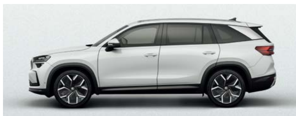
月光白 | 2Y2Y