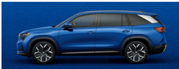
RS 藍 | 8X8X