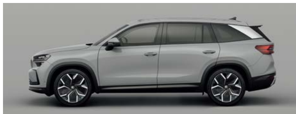
鐵灰 | M3M3