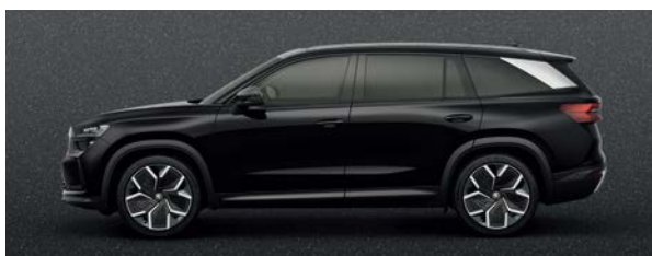
神秘黑 | 1Z1Z